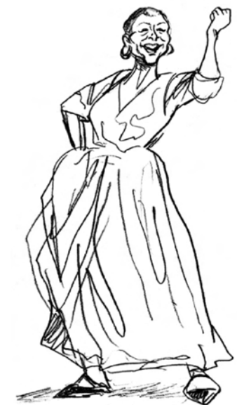
Dessins d'Avrile & Jal parus dans Sésame