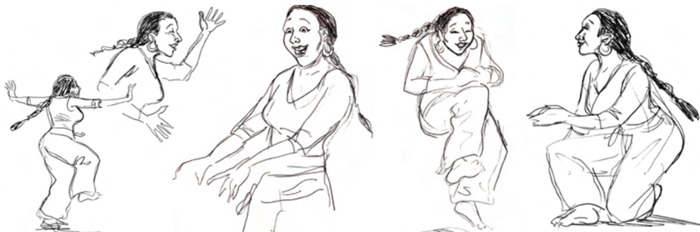
Prospectu' n°1 - Mardi 13 août 2013