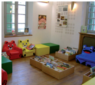
Prospectu' n°1 - Mardi 13 août 2013

PROSPECTU' Gazette des Rencontres de la Parole Directeur de la publication Christiane Belœil Rédacteurs Anne De Belleval Franck Berthoux Visuel : Serge Fiorio imprimé par CG04